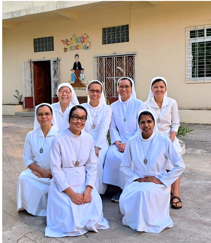
Canossian Sisters in Myanmar